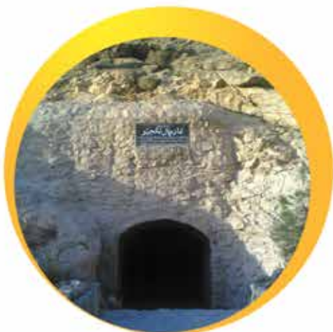
ورودی غار چال نخجیر

غار «چال نخجیر» در استان مرکزی بین دو شهر دلیجان و نراق است. این غار زیبا زیر کوهی به نام «کوه تخت» تشکیل شده است. هنوز انتهای این غار شناخته نشده است.