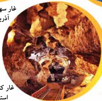
غار کتله خور در استان زنجان