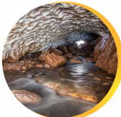
غار یخی چما در استان چهارمحال و بختیاری