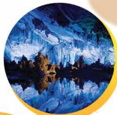
غار علیصدر در استان همدان