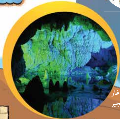
داخل غار چال نخجیر