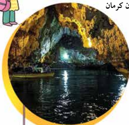
غار سهولان در استان آذربایجان غربی