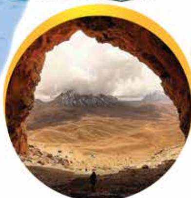
غار ایوب در استان کرمان