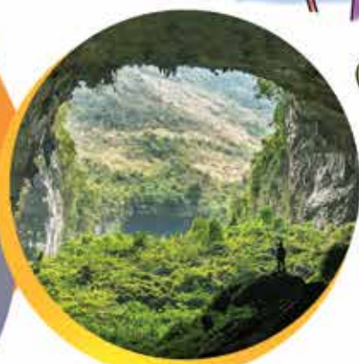
غار رود افشان در استان تهران